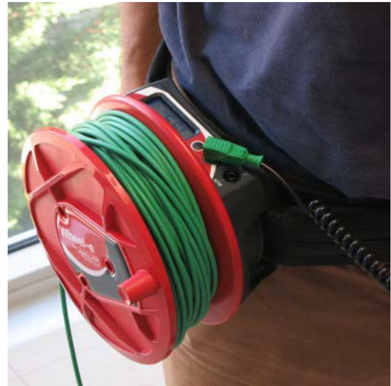
Un courant d'innovation dans le contrôle d'installation